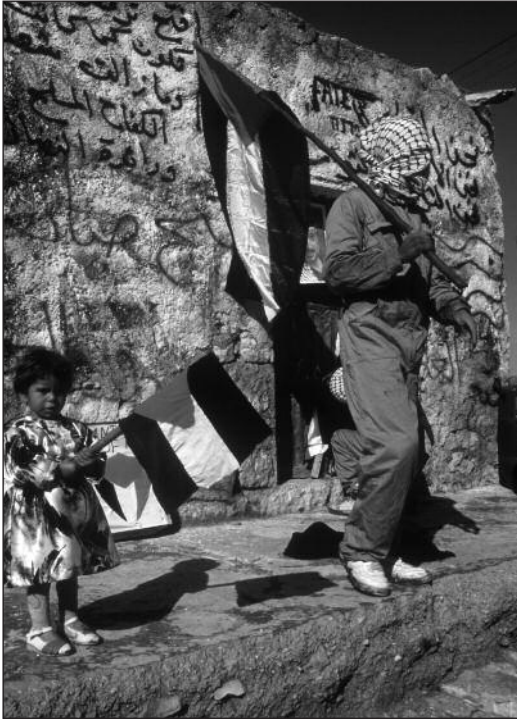
L'Etat palestinien, une notion récente.

Cette notion s'est créée «grâce» à quatre siècles et demi d'occupations : d'abord par les Ottomans, puis les Britanniques et enfin les Israéliens. Arafat est devenu le porte-drapeau de cette identité, qui s'est fortement renforcée depuis la première Intifada (1987). Intifada signifie «soulèvement» ; c'est ainsi que cette révolte a été perçue à l'époque par les Israéliens et les Palestiniens. S'il y a eu une période d'accalmie ensuite, c'est parce que les Palestiniens ont compris qu'un Etat palestinien pourrait voir le jour.