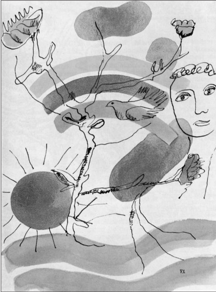
«Après le déluge», lithographie de Fernand Léger pour «Les Illuminations» (éd. de 1949).

est amputé d'une jambe à Marseille, reçoit les sacrements et meurt.