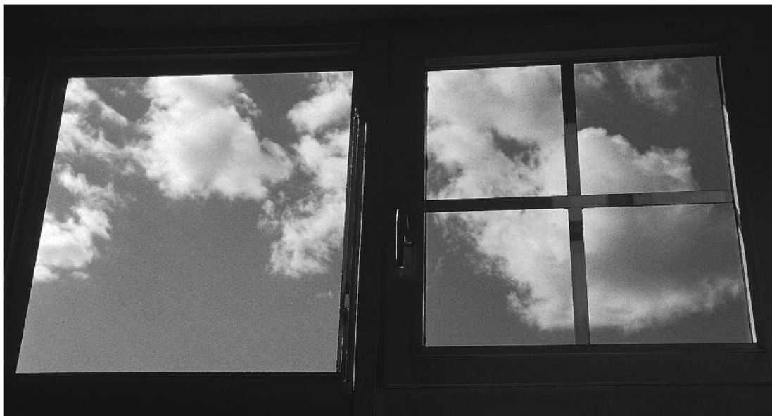
La prière, une fenêtre sur l'au-delà.

fonde et plus riche que la seule lecture ou la récitation de la Parole. La Parole invite à la prière et conduit à une réalité plus profonde, la source de la Parole, appelée Dieu. On dit que la Parole de Dieu est à la fois un miroir et une fenêtre : un miroir, parce qu'elle nous révèle ce que nous sommes, une fenêtre, parce qu'à travers elle, nous explorons la réalité hors de nos frontières, au-delà de nous-mêmes. 4