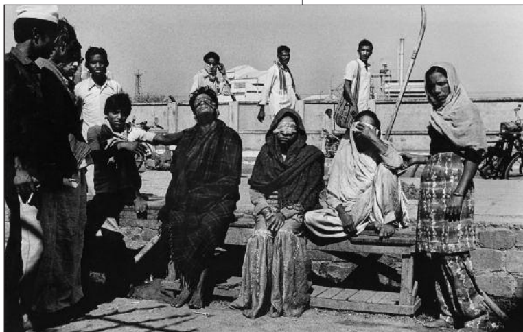
Bhopal, 20 ans d'oubli.