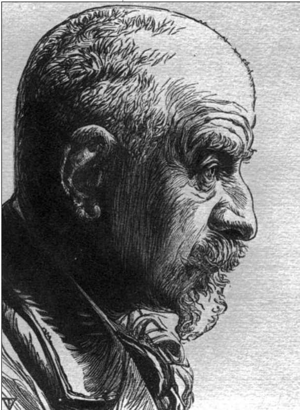
J.K. Huysmans, gravure de Vibert

le Littre avec une sorte de « pourlèchement » linguistique, le taedium vitae d'un raffiné qui s'enferme dans la solitude où il fuit ses dégoûts et cultive ses quelques goûts.