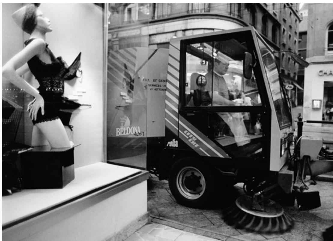
Balayer de rue, Genève, 1991