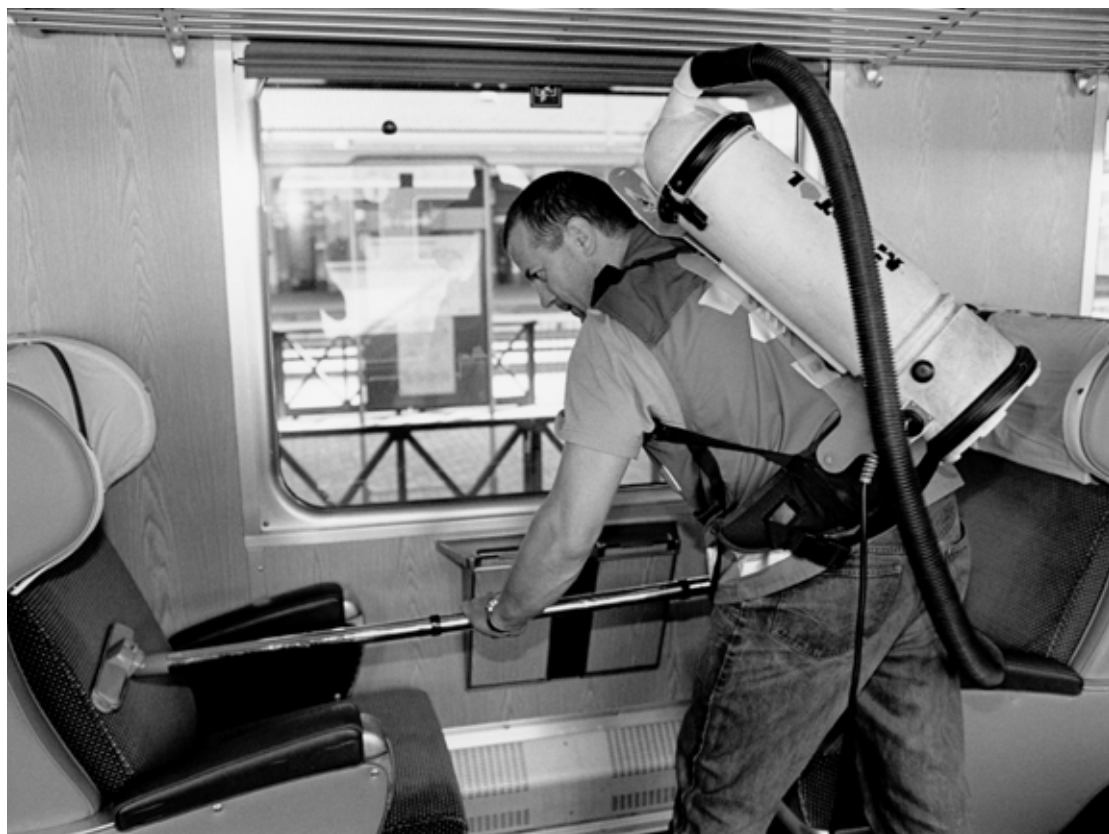
Nettoyeur de train, Chiasso, 1998