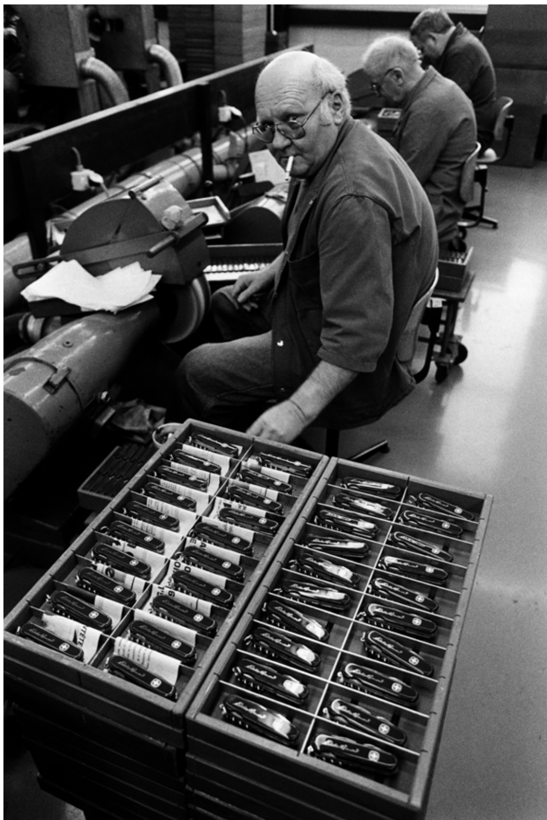
Usine Wenger, Delémont, 1992