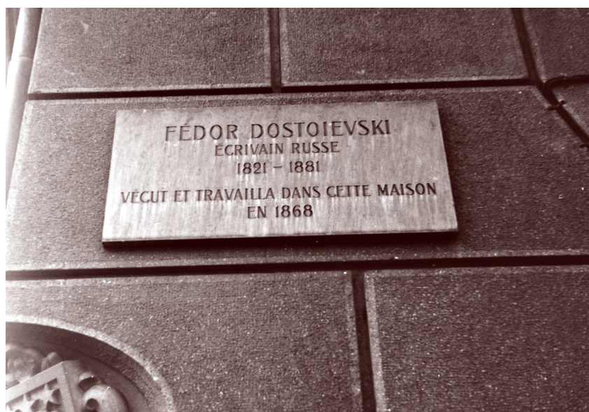
Plaque commémorant le séjour de Dostoïevski à Vevey, posée en 1968

Cette scène est en rapport avec la mort du Christ dans la mesure où le prince se concentre totalement sur le crucifix tendu au condamné (Dostoïevski VIII, 21). Les tourments du supplicié lui inspirent cette remarque : « Le Christ a aussi parlé de ce