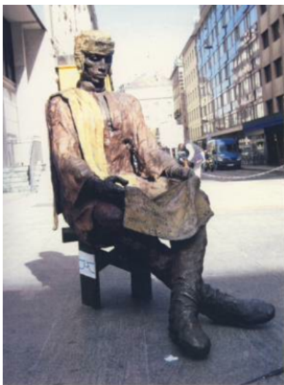
Le sans-papier, bronze à la rue du Mont-Blanc, Genève

plusieurs années ne suffit pas à expliquer la situation actuelle.